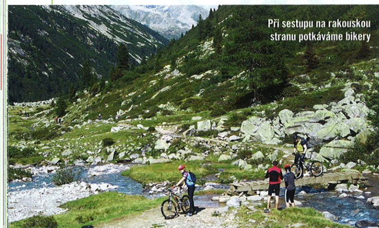
Při sestupu na rakouskou stranu potkáváme bikery

Když si chlapci nedali vymluvit, že fotka na Googlu a skutečnost nemusejí být totéž... a my ostatní jsme je v tom nechťeli nechat samotné. Hlavně že všechno dobře dopadlo. Vy buďte při plánování obezřetnější!