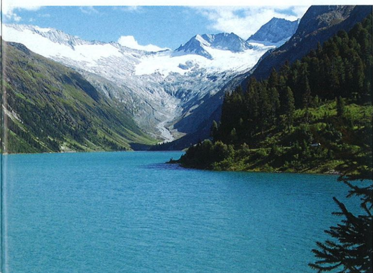
Přehradní jezero Schlegeisspeicher 1782 m n. m. jsme obdivovali na trase dolů

meny byly (ne všude, ale dost často) tak velké a tak početné, že nejen my, ale i lépe vybavení jezdci své MTB stroje vedli nebo tlačili. V botách s nášlapy žádná radost. Naštěstí se žádné zvrtnutí kotníku nebo jiná nepříjemnost nekonaly a okolní krajina byla stále ke koukání nebo spíš kochání se. I krávy u cesty jsou tu fotogenické. Celkově bych to nazval poznávání Zillertálských Alp hodně zblízka.