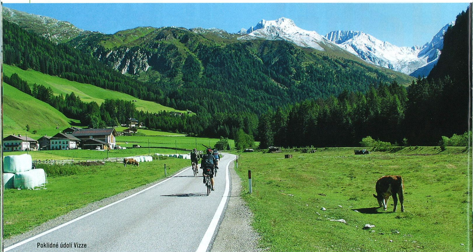
Poklidné údolí Vizze