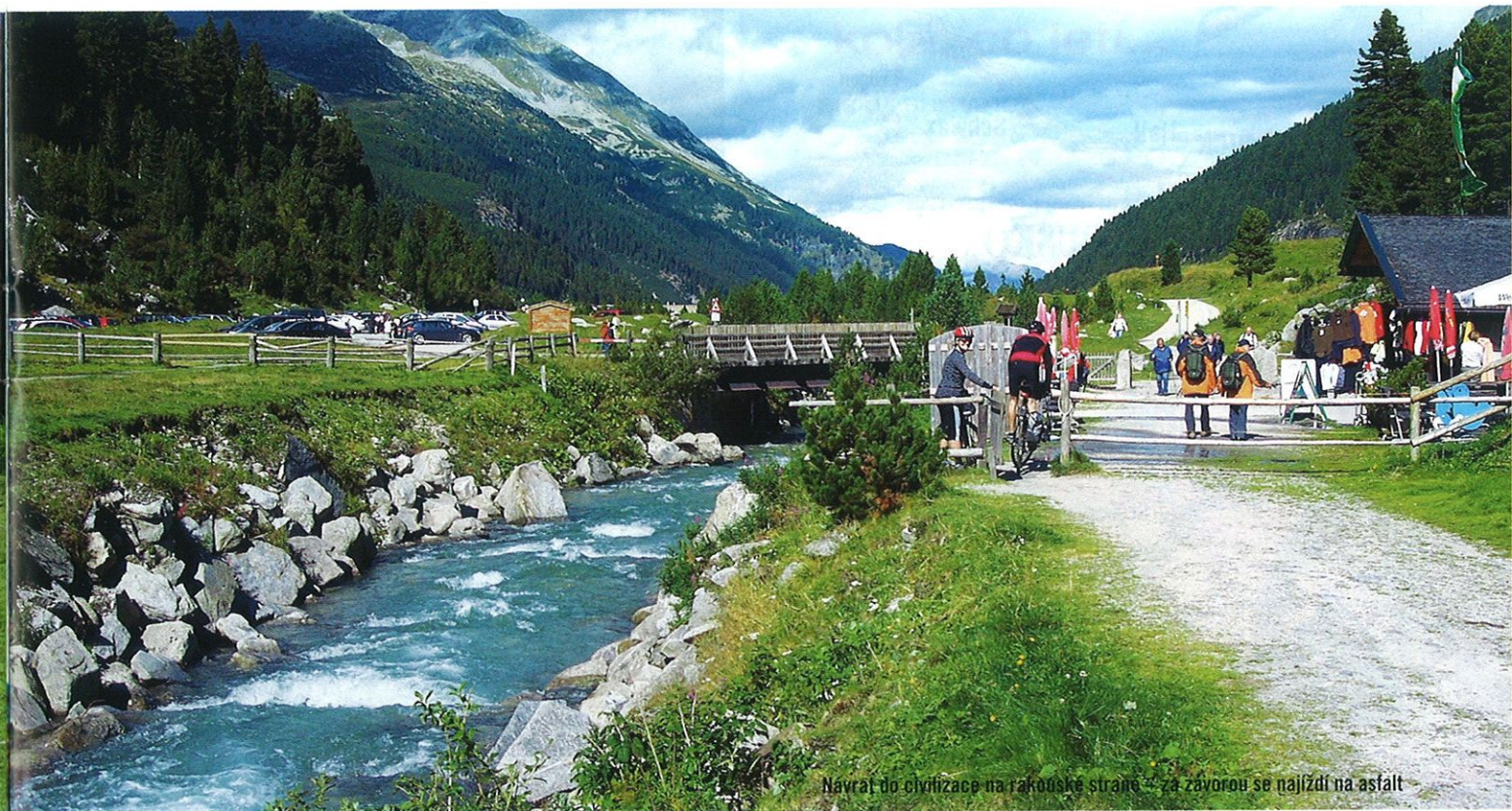
Návrat do civilizace na rakouské straně – za zavorou se najíždí na asfalt

text Michal Třetina