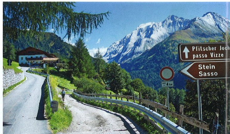
Končí asfalt, začíná šotolina a nádherné scenérie

A už je to tady, silnička se najednou úplně otáčí, přesně do protisměru. A za chvíli následují (naštěstí jen pár) krátké prudší úseky mezi seníky a jiný-