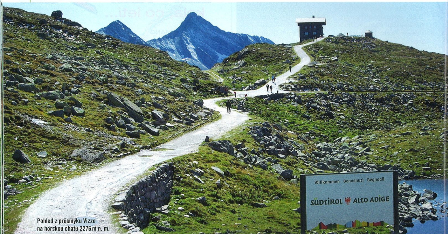
Pohled z průsmyku Vizze na horskou chatu 2276 m n. m.

probírat, jaké máme možnosti. Mezitím jsme najeli na pohodovou cyklostezku podél Zillu. Ale zase bylo něco špatně. Tentokrát protivítr. Foukal od severu a byl hodně silný, opravdu nepříjemný. Říká se, že protivítr je horší než kopec. S tím souhlasím. Sice jsme se střídali, ale únava rostla. Jediným zpestřením, kromě klidné stezky, kterou první trojice, rovněž spěchající, nějak minula nebo nenašla, byl pohled na parní vláček jezdící údolím sem a tam.